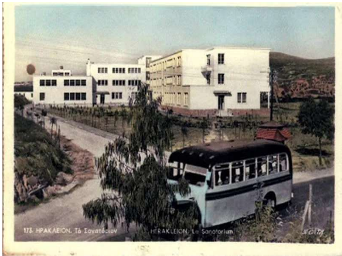
Το Βενιζέλειο ως σανατόριο αρχές της δεκαετίας του 1960