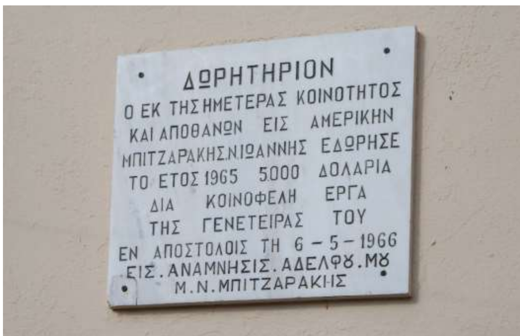
Η παραπάνω πινακίδα είναι τοποθετημένη στο κοινοτικό κατάστημα των Αποστόλων.

Η πραγματική αγοραστική αξία των 5.000 δολαρίων του 1965 σήμερα είναι 250.000 ευρώ.